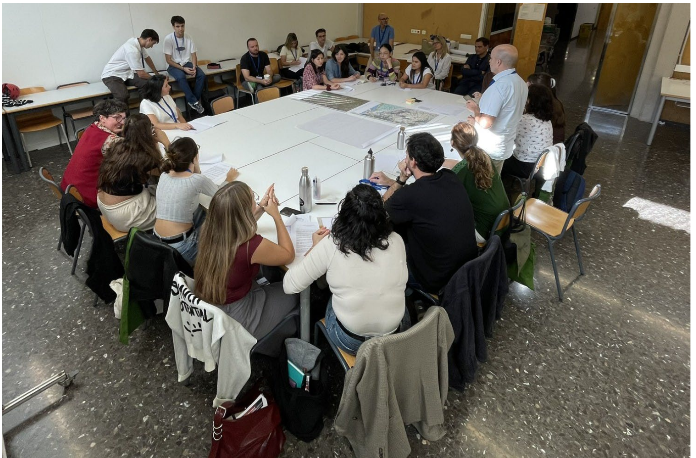
MESA 4 _Estudios de Paisaje: herramientas, metodologías y problemáticas