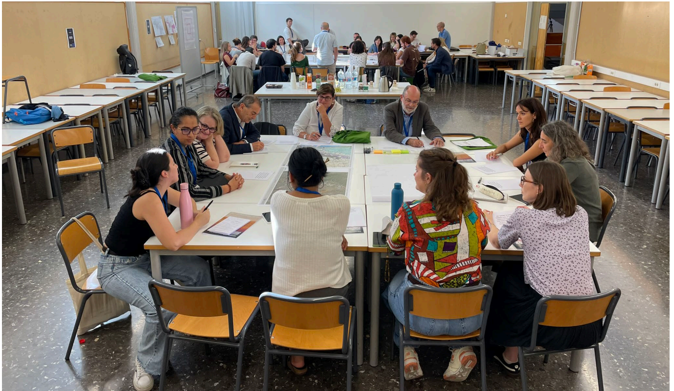
MESA 3 _Gestión de Riesgos en el Paisaje: Diagnóstico y soluciones