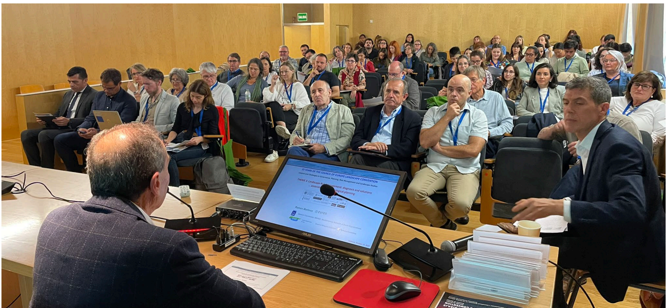
APERTURA DE LAS JORNADAS Y PRESENTACIÓN DE PONENCIAS