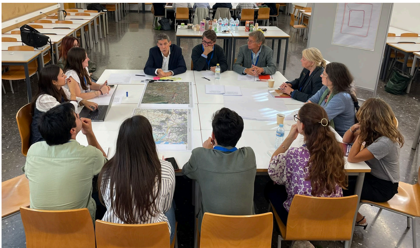
MESA 2 _Gobernanza del Paisaje: el paisaje como lugar de consensos