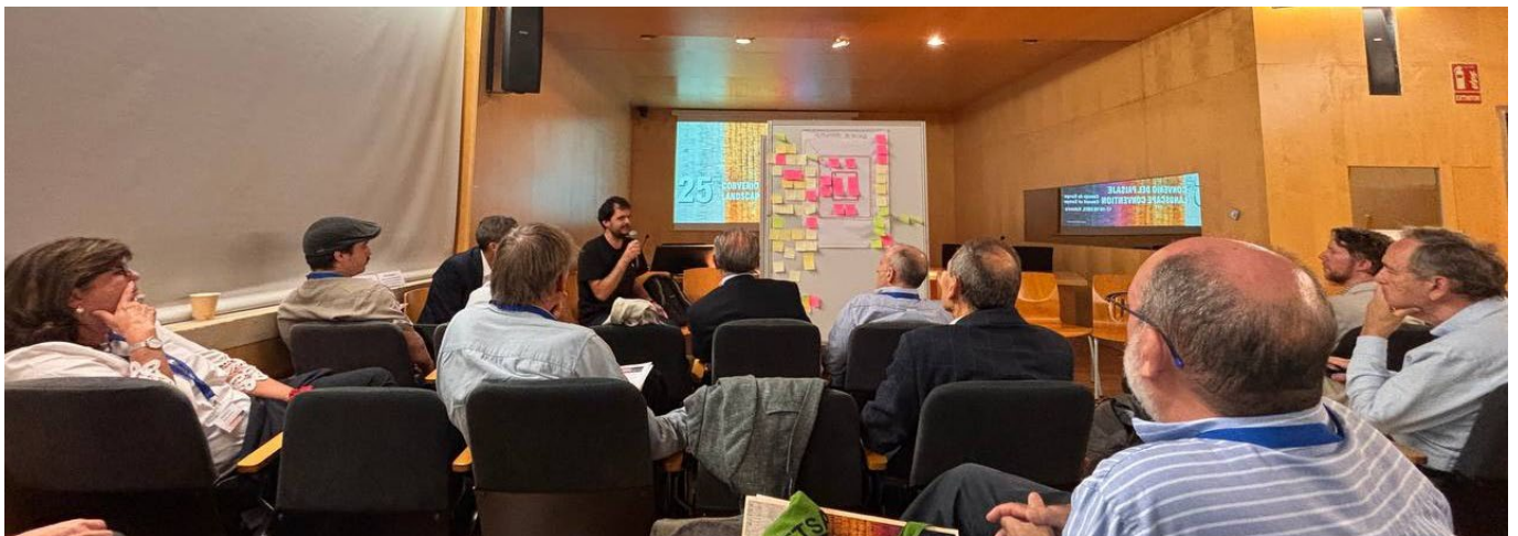
Sesión Plenaria y Conclusiones