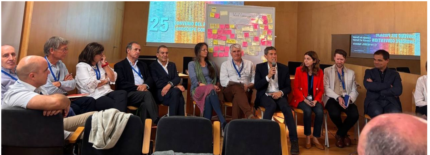
Sesión Plenaria y Conclusiones