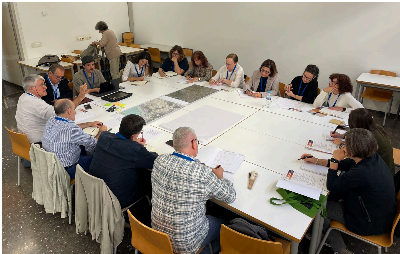
MESA 1 _Planificación y Paisaje: Perspectivas del planeamiento territorial y sectorial, y aportaciones desde el paisaje