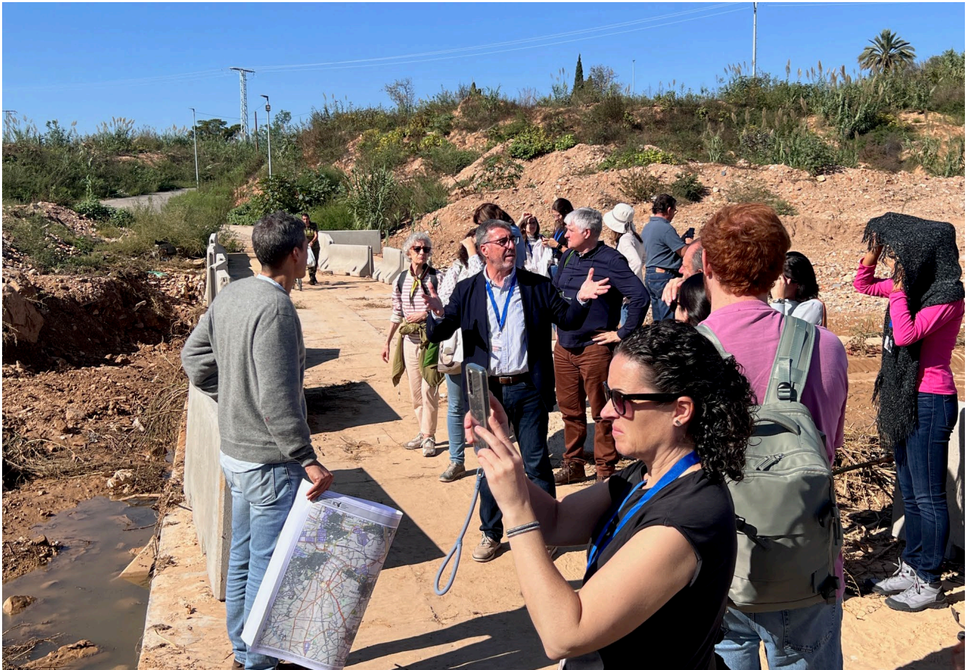
Visita a la zona afectada por la DANA 2024. Parada en la confluencia de los barrancos de Horteta y Gallego