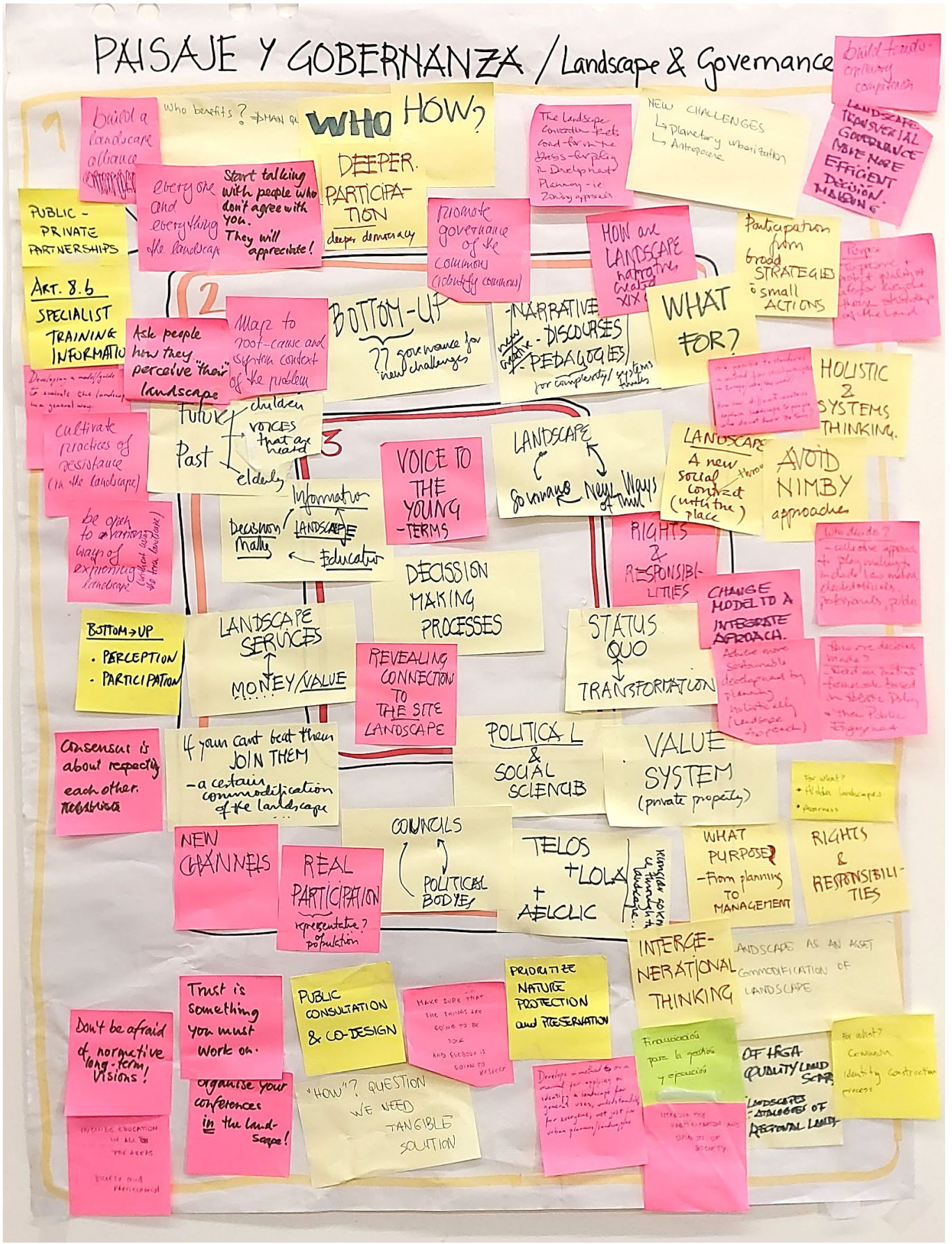
POSTER PRODUCIDO EN MESA 2_Gobernanza del Paisaje: el paisaje como lugar de consensos